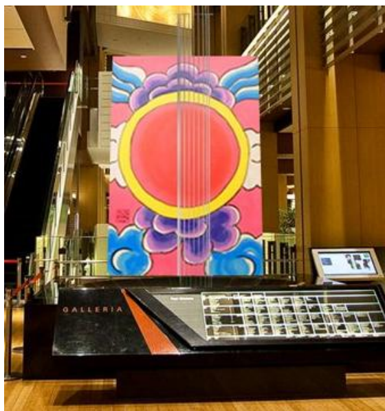
※日の出凧展示イメージ