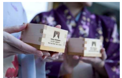
↑ 振る舞い酒イメージ