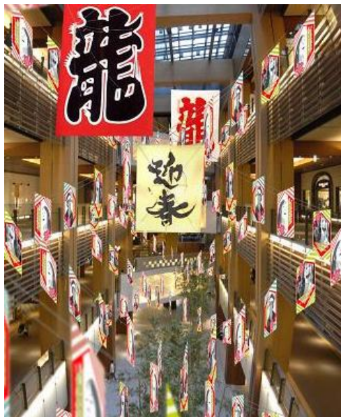
※笑顔凧展示イメージ