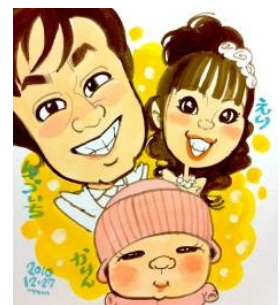
↑ 似顔絵凧イメージ

※上記のオリジナル凧は紐をおつけしますので、実際に凧揚げをして遊んでいただくことができます。