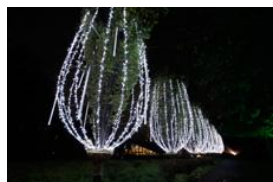
▲シャンパンイルミネーション

街全体が光に包まれる東京ミッドタウンのイルミネーション(2012年11月15日~12月25日)。その幻想的な世界をゆったりと眺めながらディナーが楽しめる14店舗を紹介します。