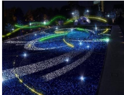
▲クリスマスイルミネーション (左)スターライトガーデン (右)ツリーイルミネーション