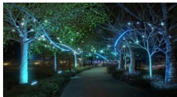
▲スターライトロード