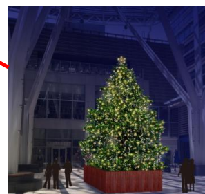
▲魔法の森のクリスマスツリー