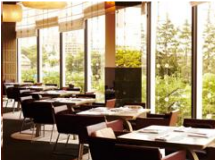
▲SILIN 火龍園 (シリノ/ファン・ロン・ユエン) ガーデンテラス 2F