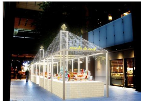
▲クリスマス市 「marché de Noël」 (マルシェ・ド・ノエル)