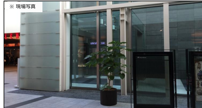
※これまでの展示例