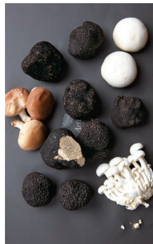
小麦粉や米、乳製品や卵との相性がよいトリュフ。パリ本店にはない日本独自のオリジナルメニューも多数用意。

プロでも見極めが難しい天然のトリュフは、南仏プロヴァンスから直送される新鮮な最高級トリュフを使用。ひとつひとつ見て触れて、さらに少し削って中の状態を確認したものだけを厳選するというこだわり。この秋のおすすめ「フレッシュトリュフとキノコのスープ」はトリュフと好相性の旬のキノコがたっぷり。牛乳を使ったトリュフ風味のカプチーノに、削りたてのフレッシュトリュフを散らした、まさにトリュフづくしの贅沢な逸品です。