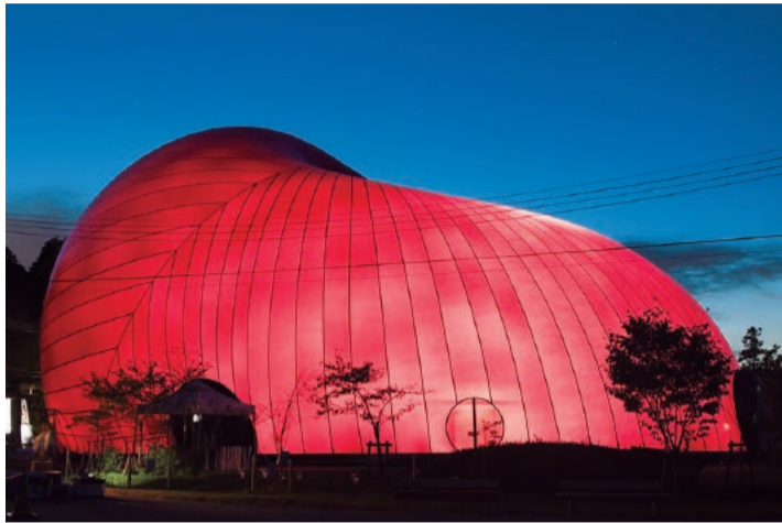
2013年宮城県松島町で初公開された時のライトアップの様子。

1990年のヴェネチア・ビエンナーレではイギリス代表として出展し、2000年賞を受賞。1991年には50歳以下のイギリス人もしくはイギリス在住の美術家に対して贈られるターナー賞を受賞している。日本では金沢21世紀美術館などに作品が所蔵されている。