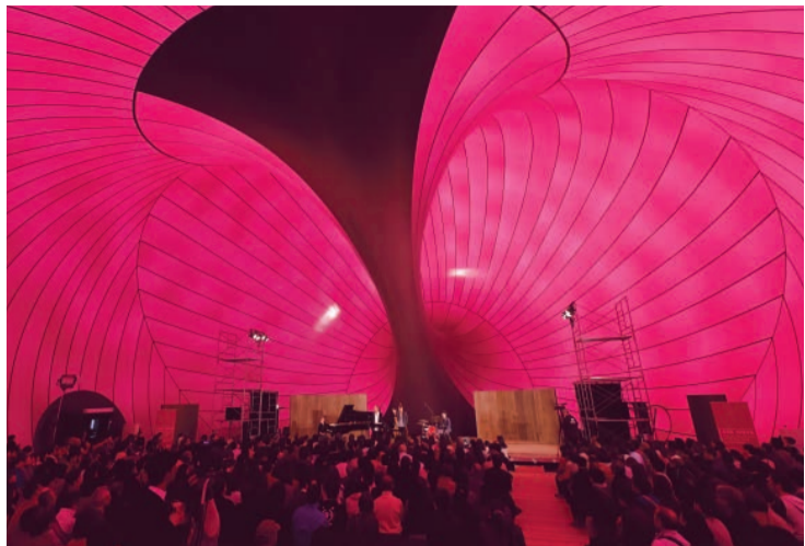
異空間に入り込んだようなアークノヴァの内部(収容人数494名)。

アーク・ノヴァ ライトアップ 18:00~23:00 ※イベント実施時は、ライトアップの時間や演出が一部変更になる場合があります。