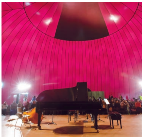
独創的なアート空間の中で聴く演奏はまた格別。

※演奏時間 各45分~1時間 ※10/2(月)19:00の回では、演奏終了後、「被災地のために芸術ができること」をテーマにしたシンポジウムが行われます。 ※出演者やプログラム等の詳細は下記のKAJIMOTO公式サイトをご覧ください。