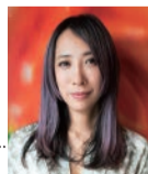
にながわ みか 蜷川実花 (メインプログラム・ アーティスト)

六本木がアートに包まれる2日間！今年のテーマは「未来ノマツリ」。メインプログラム・アーティスト蜷川実花によるインスタレーションをメインに、世界中から彩り豊かなアートパフォーマンスが集結！夢のような一夜をお届けします。