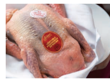
フランス産仔鳩はフィールドかつ繊細な味わいが人気。高たんぱく・低カロリーと健康志向にもぴったりです。

高級食材をアートのように美しく仕上げるフィリップ・ミルのスペシャリティは「仔鳩のファルシー」。主役の仔鳩には、フランス産かつレーサビリティーのしっかりした600gアップのものを厳選。フランスの星付き店御用達の認定マーク付きラカンの仔鳩は、鉄分が多くしっとりとした赤身が特徴です。赤ワインのソースを纏ったファルシーにはモモ肉やささみ、マッシュルームと鶏のムースが詰まり、夢のように繊細な味わいを楽しませてくれます。