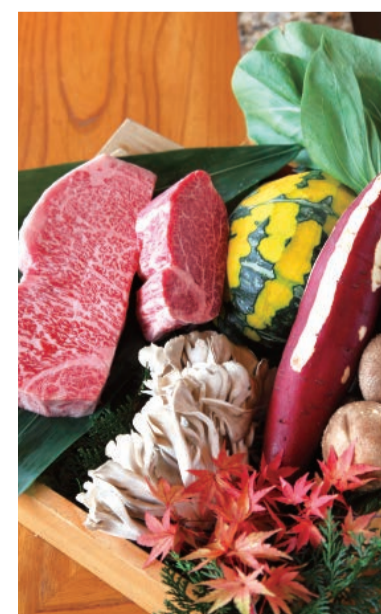
見事なサシの黒毛和牛。熟練の焼き手による、脂を落としながらもうまみを逃さない、絶妙な焼き加減でご提供。

(人形町半)の目利きが全国から選り抜いた黒毛和牛を中心に、四季折々の旬の食材を味わえる「喜扇コース」。自社の厳しい基準をクリアした国産の黒毛和牛は、肉を一定期間寝かせるウェットエイジングで引き出されるうまみと、絶妙な焼き加減、舌の上でとろける食感が三位一体となって、まさに絶品の味わいです。今秋は、魚介に伊勢海老や鮑もお目見え。極上の黒毛和牛と磯香る海の幸との華麗な共演をお楽しみください。