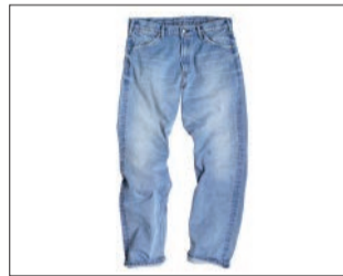
海比古比女デニム 加工 30,240円

ブランドロゴのリニューアルと共に、これまでのスタンダードデニムも一新し、流行に左右されないユニセックスサイズ展開のレギュラーストレートデニムが登場します。細部にまでこだわったデニムのはき心地をぜひお試しください。