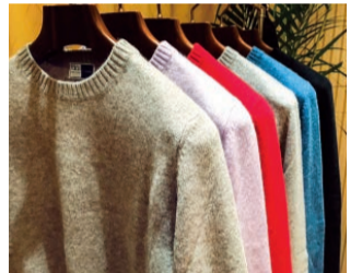
〈FEDERI〉カシミアニット各74,520円

イタリアの老舗〈FEDERI〉のカシミアコレクションが到着。職人の手仕事と確かな審美眼により高品質を保つニットは、上品で着るシーンを選びません。発色がよいことから、秋冬スタイルの差し色としても活躍してくれます。