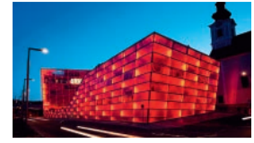
美術館や研究所の役割を持つ国際的拠点「アルスエレクトロニカ・センター」

オーストリアのリンツ市で、40年にわたり「先進テクノロジーがもたらす新しい創造性と社会の未来像」を提案し続ける世界的なクリエイティブ機関。毎年リンツ市で開催される「アルスエレクトロニカ・フェスティバル」には、世界中から最先端のメディアアートとテクノロジーが集結。