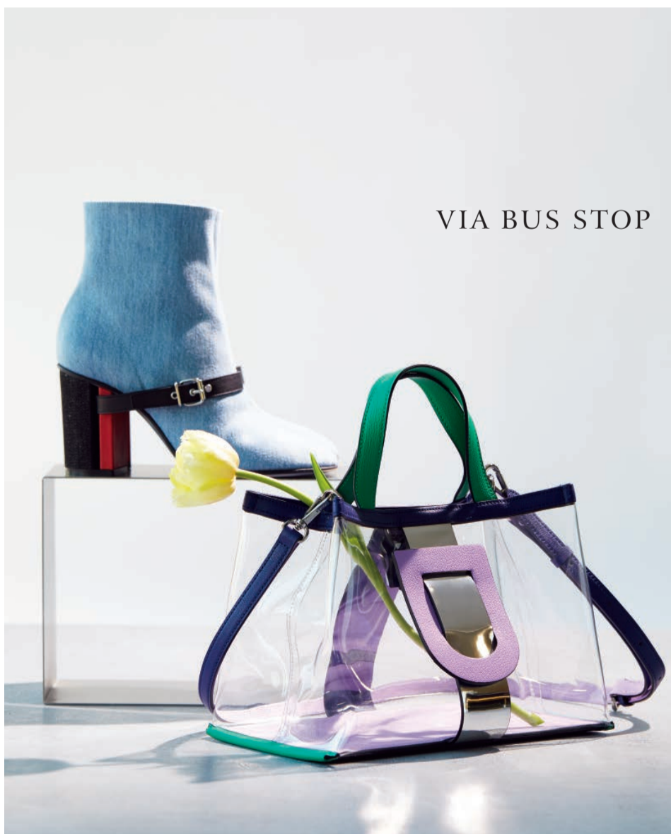
VIA BUS STOP

春の定番フラワーモチーフのブラウスは、胸元から袖にかけてのほどよい透け感が今年風。3色で施したボタニカル柄のチュール刺繍と、センターバックでリボンを結ぶ首元のデザインが甘すぎず華やか。異素材コンビのエlegantなバッグと、足もとを美しく魅せる涼しげなネイビーカラーのサンダルを合わせれば、レディなムード漂う春の装い。チュールフラワー刺繍ギャザーブラウス27,000円、ヤナギ レザー コンビバッグ63,720円、スエード ストラップサンダル22,680円(すべてANAYI)／エッセンス オブ アナイ トウキョウ(ガレリア2F) TEL.03-5647-8303