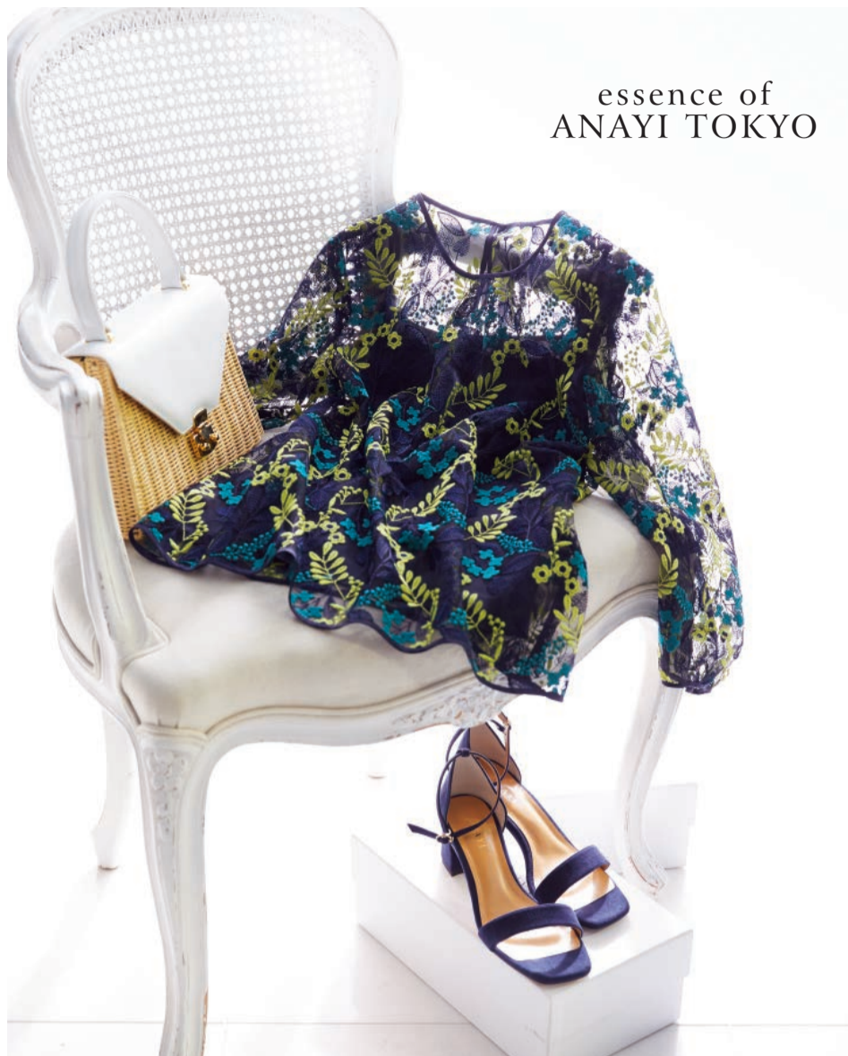
essence of ANAYI TOKYO

裾のフレアがキュートなホワイトデニムや、インディゴデニムはこの春のマストハブ。素材と軽さが人気の〈ステート オブ エスケープ〉のトートバッグにパステルカラーのリネンストールなど旬アイテムを効かせて、西海岸発大人カジュアルの完成。ホワイトデニム28,080円(Ron Herman)、インディゴスキニーデニム24,840円(RH Vintage)、バッグ42,120円(STATE OF ESCAPE)、サンダル85,320円(CANFORA)、ストール・ピンク31,320円(ASAUCE MELER for Ron Herman)、ギンガムチェック31,860円(ASAUCE MELER)／ロンハーマン(ガーデンテラスB1) TEL.03-6447-0561